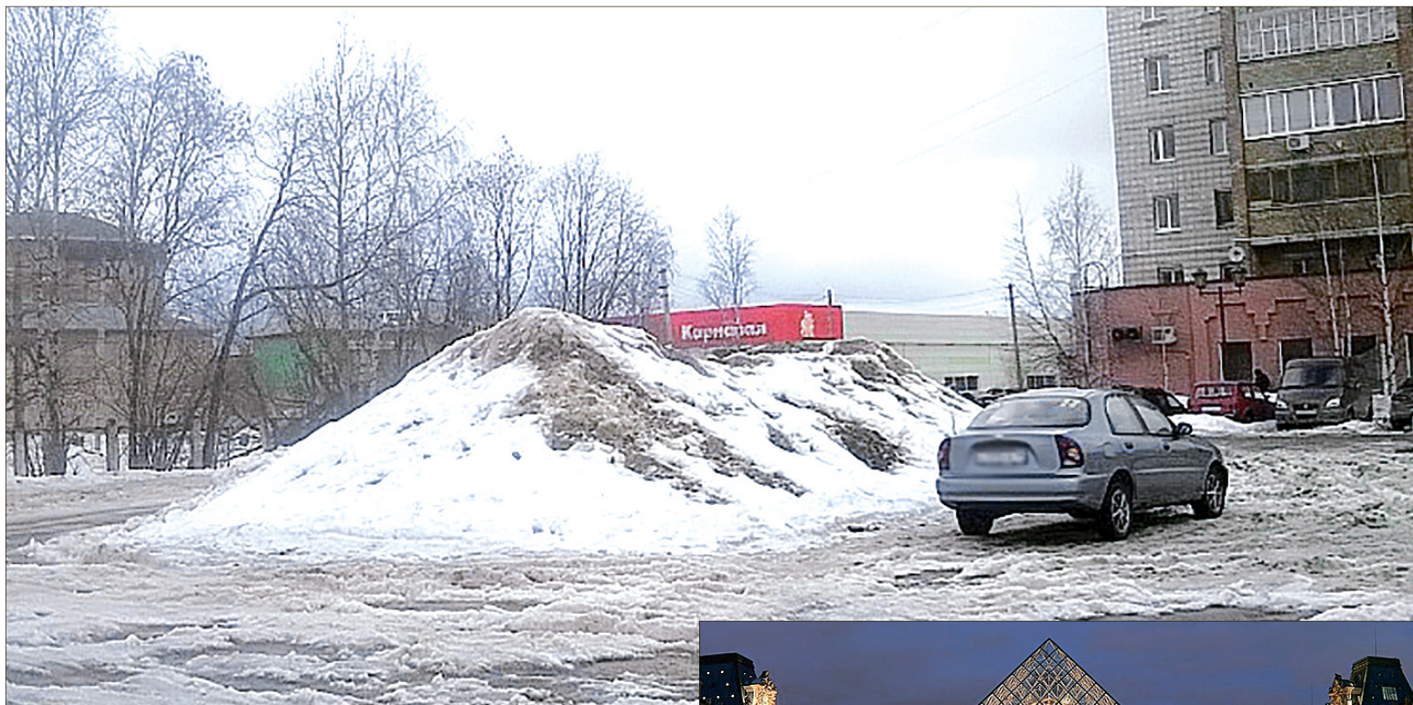
Телецентр, возле магазина «Россия».