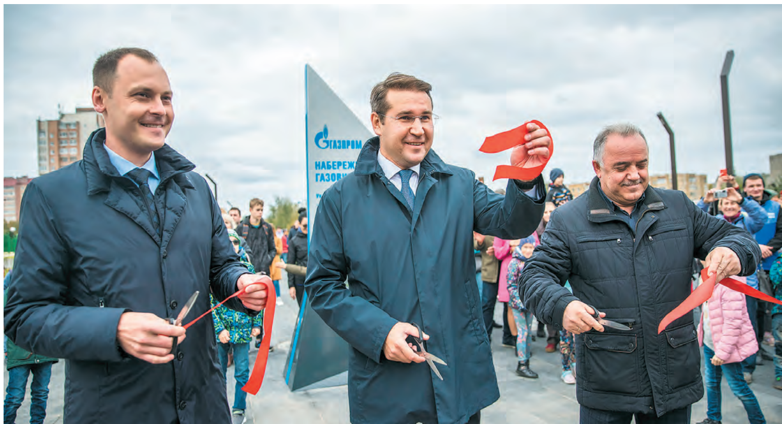
Открытие главного центра притяжения в Ухте - набережной Газовиков - радость для всех жителей города.

Одна из главных задач нашего предприятия – платить налоги. ПАО «Газпром» является одним из крупнейших налогоплательщиков, за счет которого формируется бюджет Республики Коми. Доля компаний группы «Газпром» в объеме налоговых поступлений региона составляет 23,7%. Дополнительная помощь оказывается в рамках отдельных Соглашений.