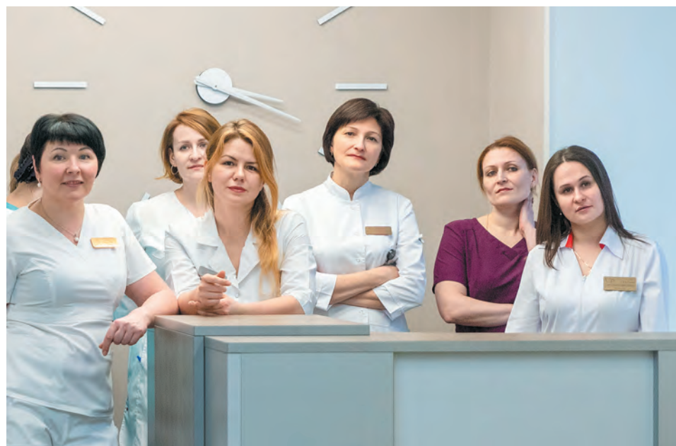
И родители, и медперсонал Межтерриториального родильного дома, и общественность выражают свою сердечную признательность газовикам за заботу о будущих поколениях ухтинцев.