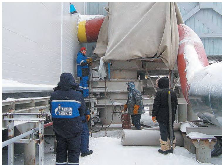
Диагностика стыков турбоагрегатов КС Гагарацкая