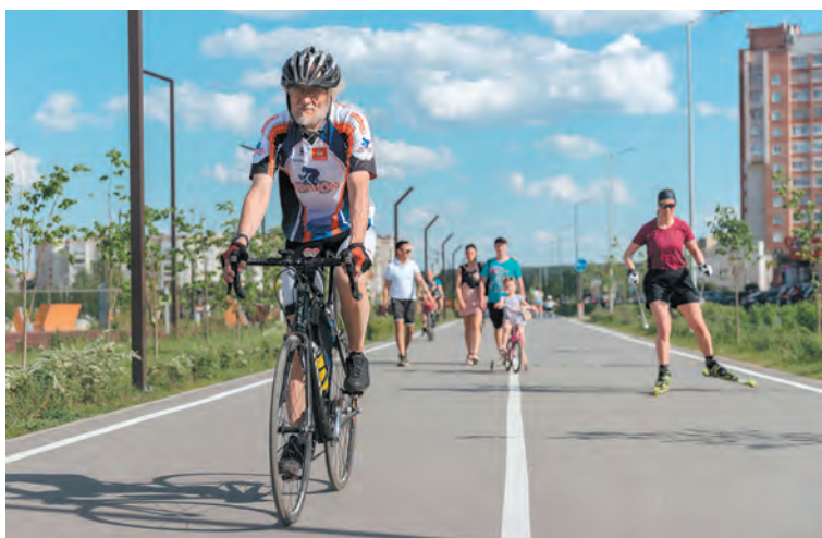
Набережная Газовиков с момента открытия стала излюбленным местом отдыха горожан всех возрастов и импульсом для развития новых увлечений здорового образа жизни.

ников Республики Коми мы будем вновь проводить скульптурный симпозиум. В первый раз мастера работали с мрамором. Сейчас это будут иные материалы, другая концепция, ближе к тем архитектурным формам, которые уже реализованы на набережной Газовиков.