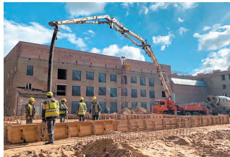
Каждое улучшение городской среды - грандиозная, масштабная работа многих специалистов. Чтобы в намеченный срок получить результат, мало одних материальных ресурсов.

Следующий момент: если ломают – не делать. А как научить культуре? Как научить, что нужно ездить по велодорожке, если велодорожки нет? Я исхожу из этой логики.