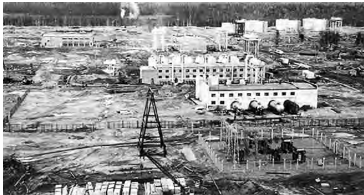
Вуктыльское газоконденсатное месторождение. Установка комплексной подготовки газа. Головные сооружения. 1969 г.

В 1980-е гг. задачей особой важности стало извлечение ретроградного конденсата. Эксплуатация Вуктыльского месторождения в режиме истощения пластовой энергии решила проблему газоснабжения страны, однако привела к значительным потерям