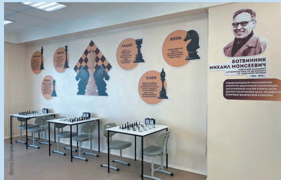
Благодаря грантовой поддержке в школе №23 п. Ярега появилась «Шахматная переменка».

Детский сад № 60 получил грант на оборудование для тифлокаби-