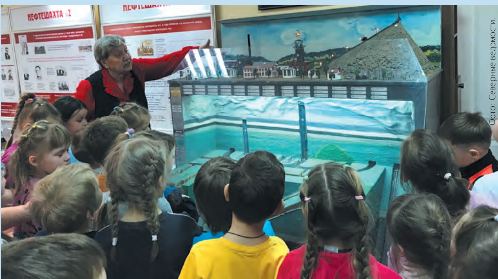
На экскурсии воспитанники подготовительных групп детского сада №32.

Не самая явная достопримечательность, потому что находится она в лесу, между нефтешахтами № 1 и 2, – памятный знак «Разведочно-эксплуатационная скважина № 62 – первооткрывательница тяжелой ярегской нефти». Вот оно – начало начал!