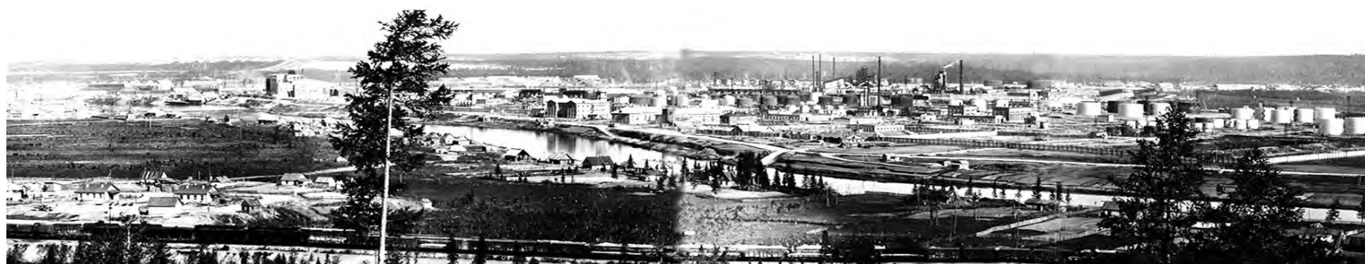
Панорама Ухты. Таким был город в конце 1950-х – начале 1960-х годов.